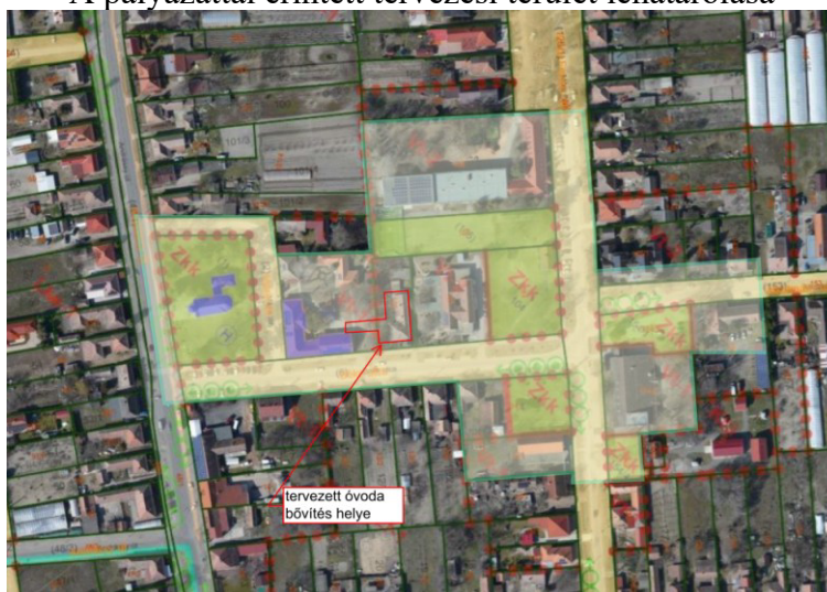
A pályázattal érintett tervezési terület lehatárolása

A községben a Mária téren álló római katolikus templomot 1927-ben Kisboldogasszony tiszteletére - Szűz Mária születésének emlékére – (1927. szeptember 28-án) szentelték fel. A hagyományoknak megfelelően a búcsú megtartására minden év szeptember 8. napjához legközelebb eső vasárnapján került